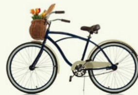
Abbildung entspricht nicht dem Gewinn.

Die Geschäfte in Breyell, Kaldenkirchen und Lobberich sind von 13 bis 18 Uhr zum unbegrenzten Shopperlebnis für Sie geöffnet.